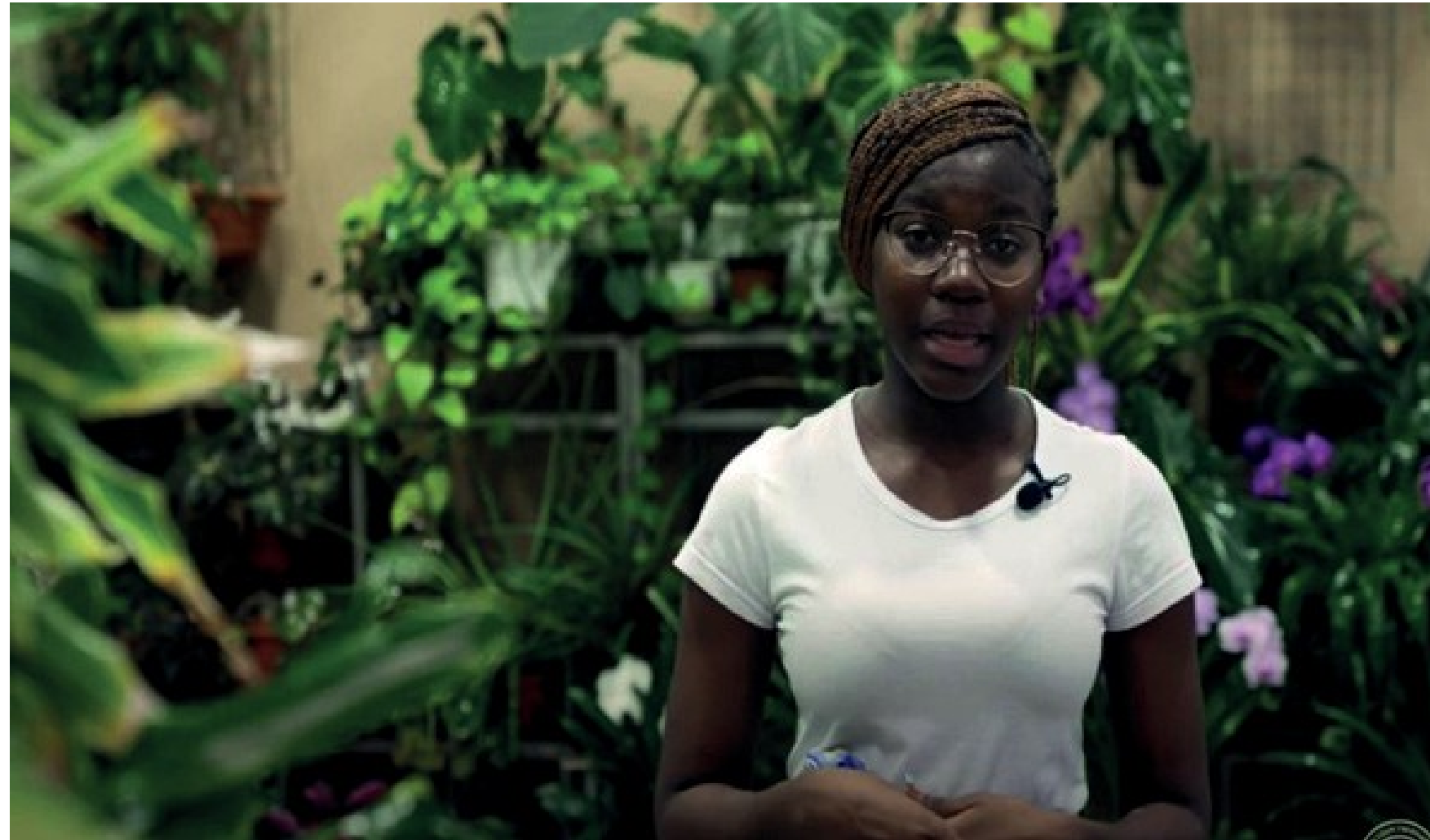
Перейра Соареш Алсими Уайт, Сан-Томе и Принсипи